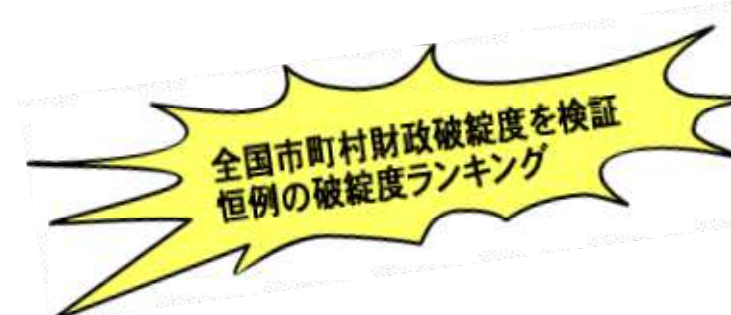
堺以南の各市の破綻度ランキング推移