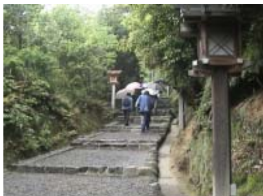
行く川の 過ぎにし人の 手折らねば うらぶれ立てり 三輪の檜原は

今回で万葉講座現地散策も5回目を数えました。 あいにくの雨模様でしたが、しっとりとした山辺の道の古 き良き時代を満喫しました。