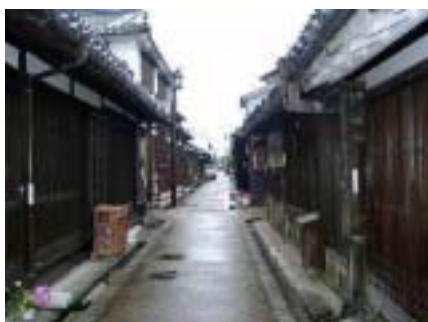
<海の堺、陸の今井といわれた今井町の町並み>