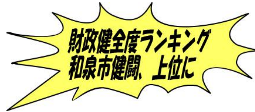
東洋経済新報社 都市データパック2018より